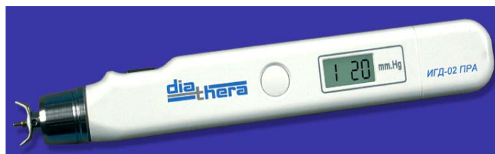
Рис. 1 Общий вид прибора - Индикатор ИГД-02 diathera

Индикатор ИГД-02 diathera разработан с учетом особенностей отечественной офтальмологической школы. Он позволяет измерить тонометрическое ВГД по Маклакову при нагрузке 10г с отображением величины ВГД на дисплее. Дополнительно на дисплее высвечивается оценка ВГД: «1» - норма (ВГД менее 26 мм рт.ст.) «0» - выше нормы (ВГД равно и более 26 мм рт.ст.)