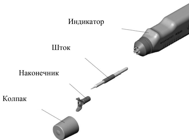
Рисунок 2 – Подготовка индикатора к очистке штокового механизма

ЗАПРЕЩАЕТСЯ одновременно проводить очистку штокового механизма двух и более индикаторов!