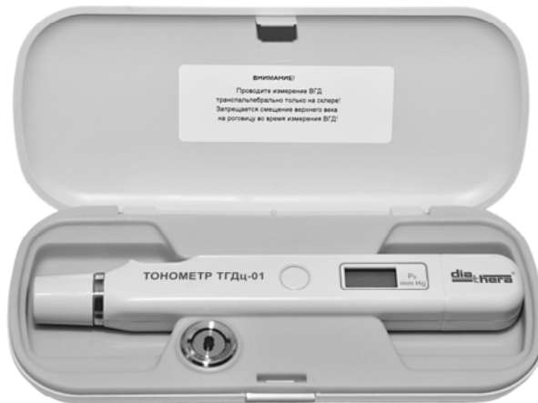
Рисунок 1 – Внешний вид тонометра в футляре